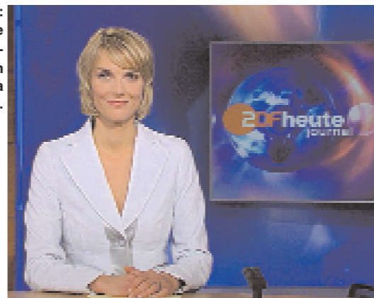
Top gestylt: unsere Moderatorinnen von Marietta Slomka ...